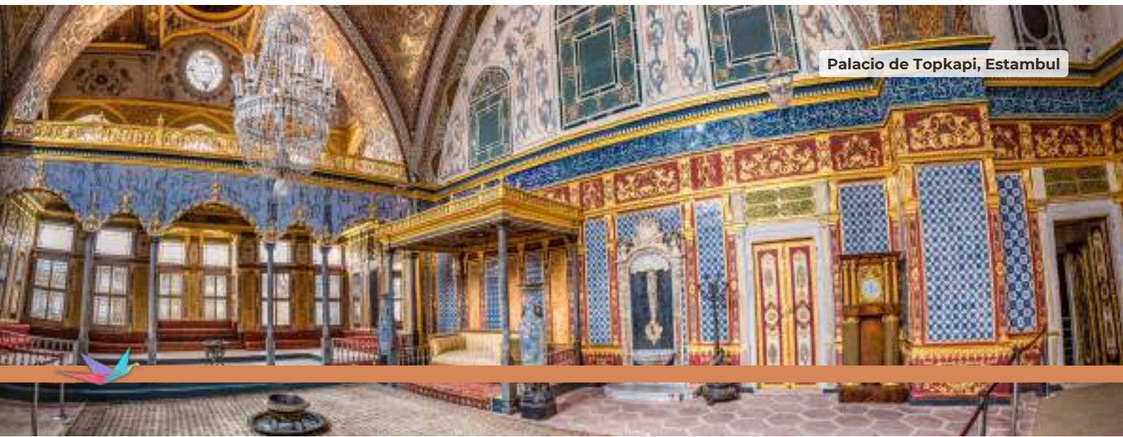
Palacio de Topkapi, Estambul

Desayuno y traslado hacia el aeropuerto.