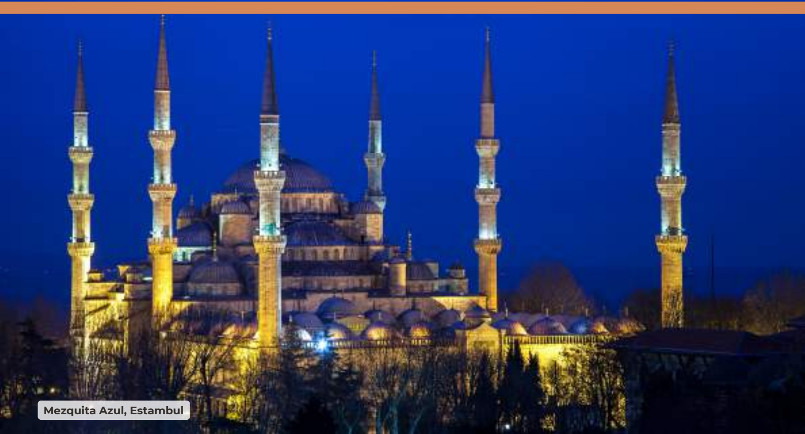
Mezquita Azul, Estambul