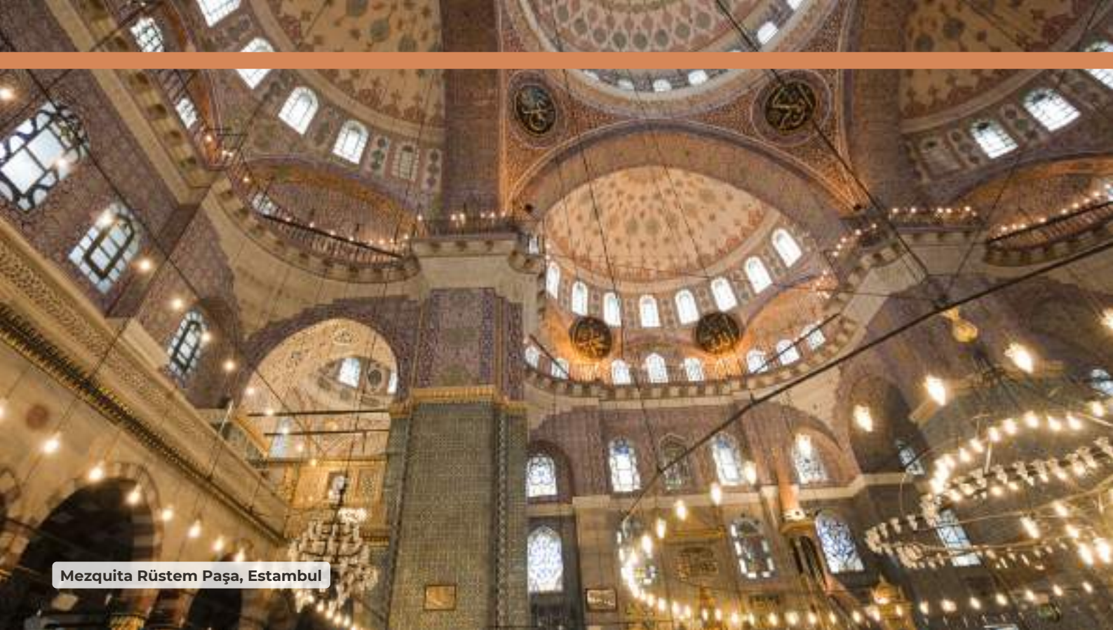
Mezquita Rüstem Paşa, Estambul