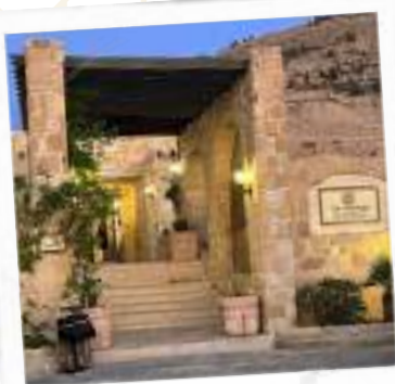
The Old Village