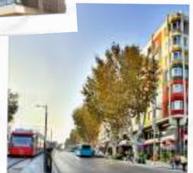
Ramada Old City