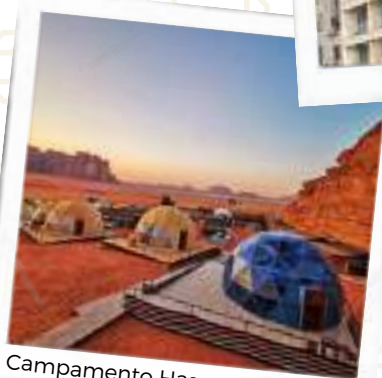
Campamento Hassan Zawaideh