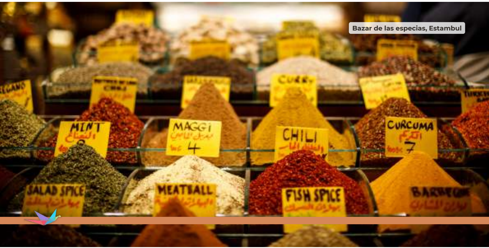
Bazar de las especias, Estambul

Desayuno en el hotel. Salida para visitar la mezquita de Rüstem Paşa o la mezquita de Sahzade, famosa por su gran cantidad de azulejos de diferentes formas geográficas y decorados con motivos florales. A continuación, realizaremos una de las actividades más famosas de Estambul, un paseo en barco por el Bósforo, canal que separa Europa y Asia. Durante este trayecto se aprecian los palacios de los Sultanes, antiguas y típicas casas de Madera y disfrutar de la historia de una manera diferente. Culminaremos nuestro día con una de las visitas estrella, el bazar de las especias, constituido por los otomanos hace 5 siglos y usado desde entonces. Almuerzo. Continuamos con el Palacio Dolmabahçe fue construido entre los años 1843 y 1856 por orden del Sultán Abdülmecid. En su construcción intervinieron cuatro arquitectos del Departamento Real de Arquitectura del Imperio Otomano. con una fachada de más de 600 metros y una superficie de 15.000 metros cuadrados, el Palacio Dolmabahçe es el edificio más grande del país. Tiene 285 habitaciones, 43 salas, 68 lavabos y 6 baños turcos. Antes de volver al hotel pasamos por el barrio otakoy, tiempo libre . Alojamiento.